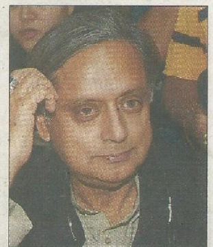
PRESS TRUST OF INDIA New Delhi, September 24

SENIOR CONGRESS LEADER Shashi Tharoor on Saturday got the nomination form for the AICC presidential poll collected from the party headquarters with sources saying he is likely to file his papers on September 30.